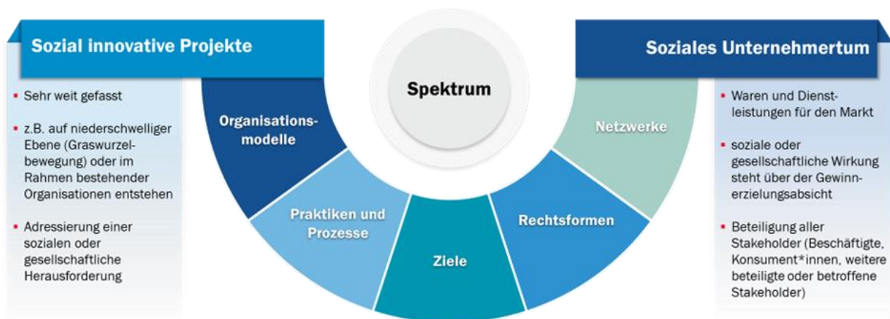
Abbildung 1: Spektrum sozialer Innovation und sozialen Unternehmertums